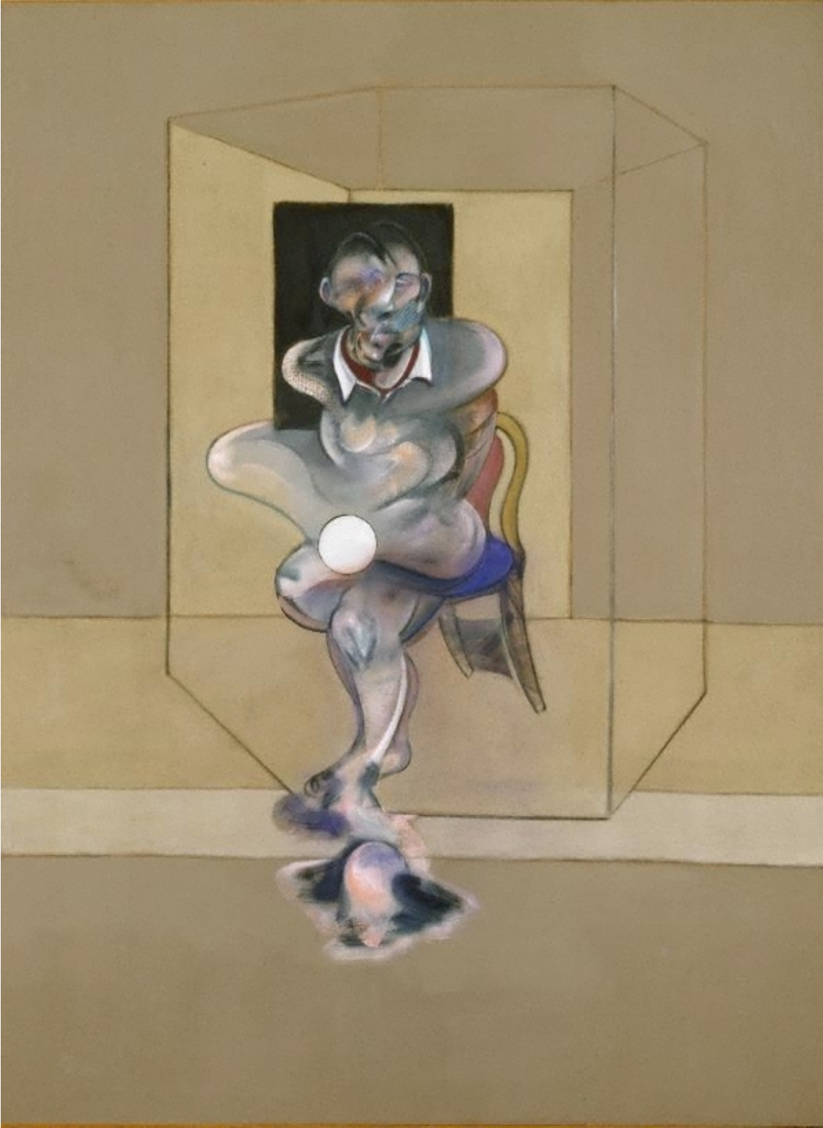
Study for Self Portrait, Francis Bacon; 1976

تُصوّر «عفاف» من جهة مقابلة ألا ترى في اللاجئيين، وهي التي أصبحت قبل ثلاثة عقود لاجئة، إلا ضحايا لا يمكن أن يتجاوزوا شرطهم كضحايا. تُصوّر أن تعتبر كل سوري عاش في ظل النظام السوري خلال العقود الماضية، بالتعريف، منهكاً،